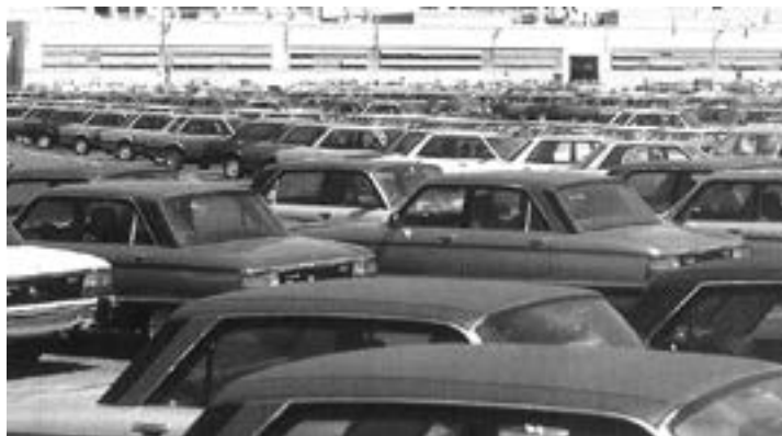
Vista de la planta de Ford Motor Argentina en General Pacheco, Septiembre de 1982.

Me acuerdo. Abro el placard de mi abuelo. Todas las tardes, antes de que mis papás pasen para volver a casa, me va a buscar a la escuela en un Ford Falcon color salmón, este es especial porque tiene caja de cambios de cinco velocidades que está adaptada. Así lo tuvo siempre, como nuevo. Abro el placard. Encuentro dos armas en el placard. No las toco. Armas viejas. Se lo cuento a mi mamá. Después supe que las vendieron. Mi abuela me dijo que Dios podía saber todo lo que yo hacía y pensaba. Y que después se lo contaba a ella.