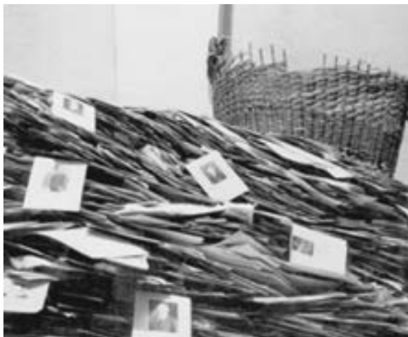
un archivo de miembros del NSDAP encontrado en Múnich.

“Estos padres no liberan a sus hijos del horror que causaron a otras personas. La culpa y la vergüenza se heredan”. De esa frase se podría sacar la conclusión que estaría bien liberar del horror a los/las descendientes de los perpetradores o seguidores menos culpables.